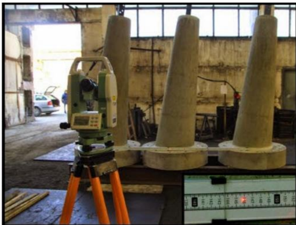
Pomiary kontrolne betonowych elementów prefabrykowanych.