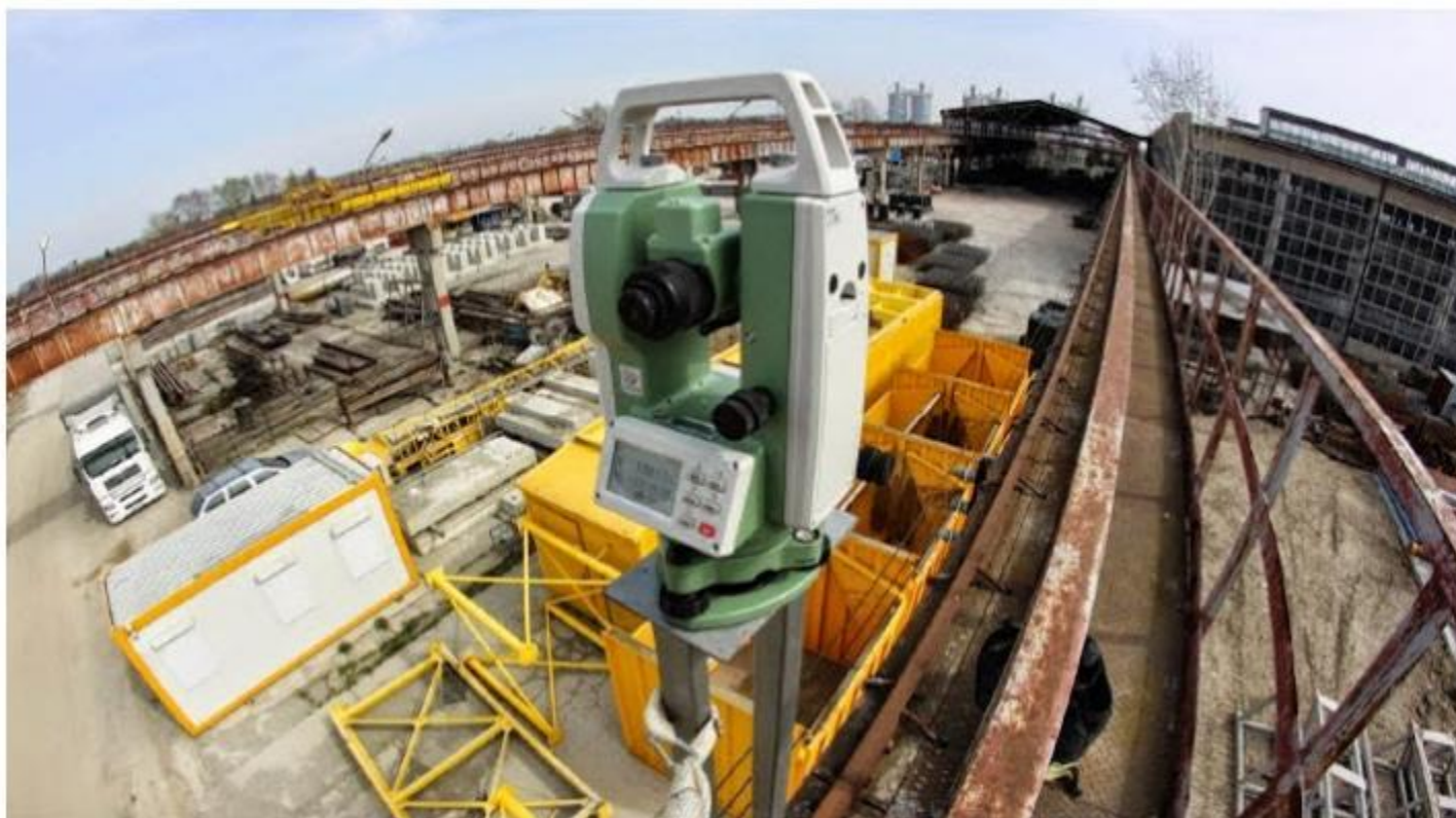
Pomiar kontrolny suwnicy.