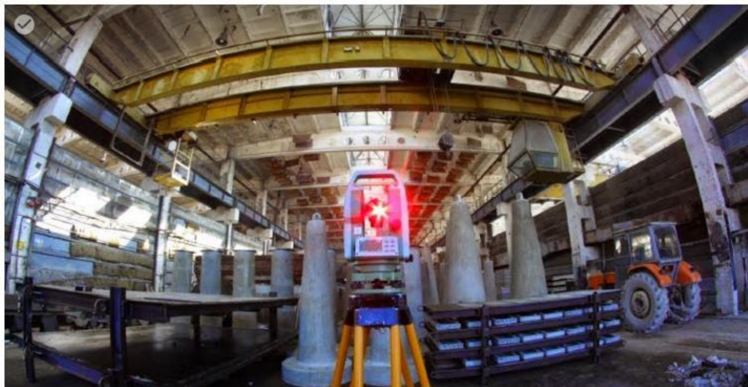
Pomiary kontrolne betonowych elementów prefabrykowanych.