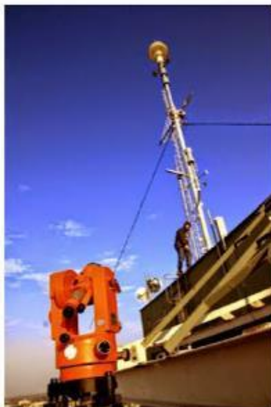
Pomiar pionowości masztu antenowego.