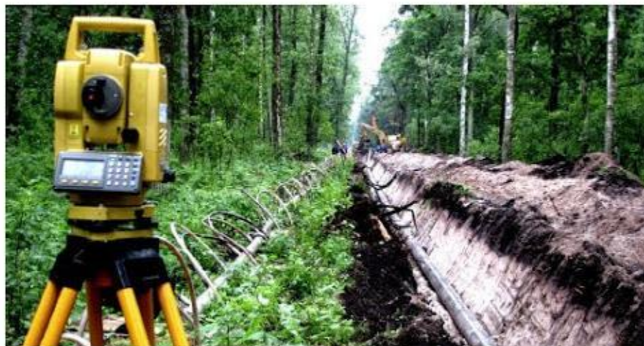
Geodezyjna obsługa budowy gazociągu wysokoprężnego.