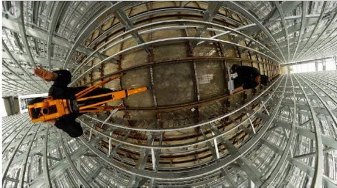
Geodezyjna obsługa budowy dojrzewalni betonu.