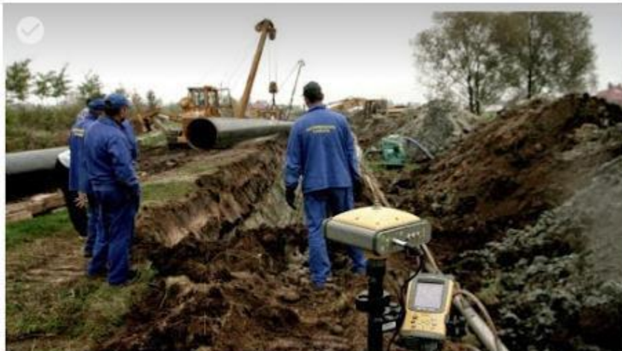
Geodezyjna obsługa budowy gazociągu wysokoprężnego.