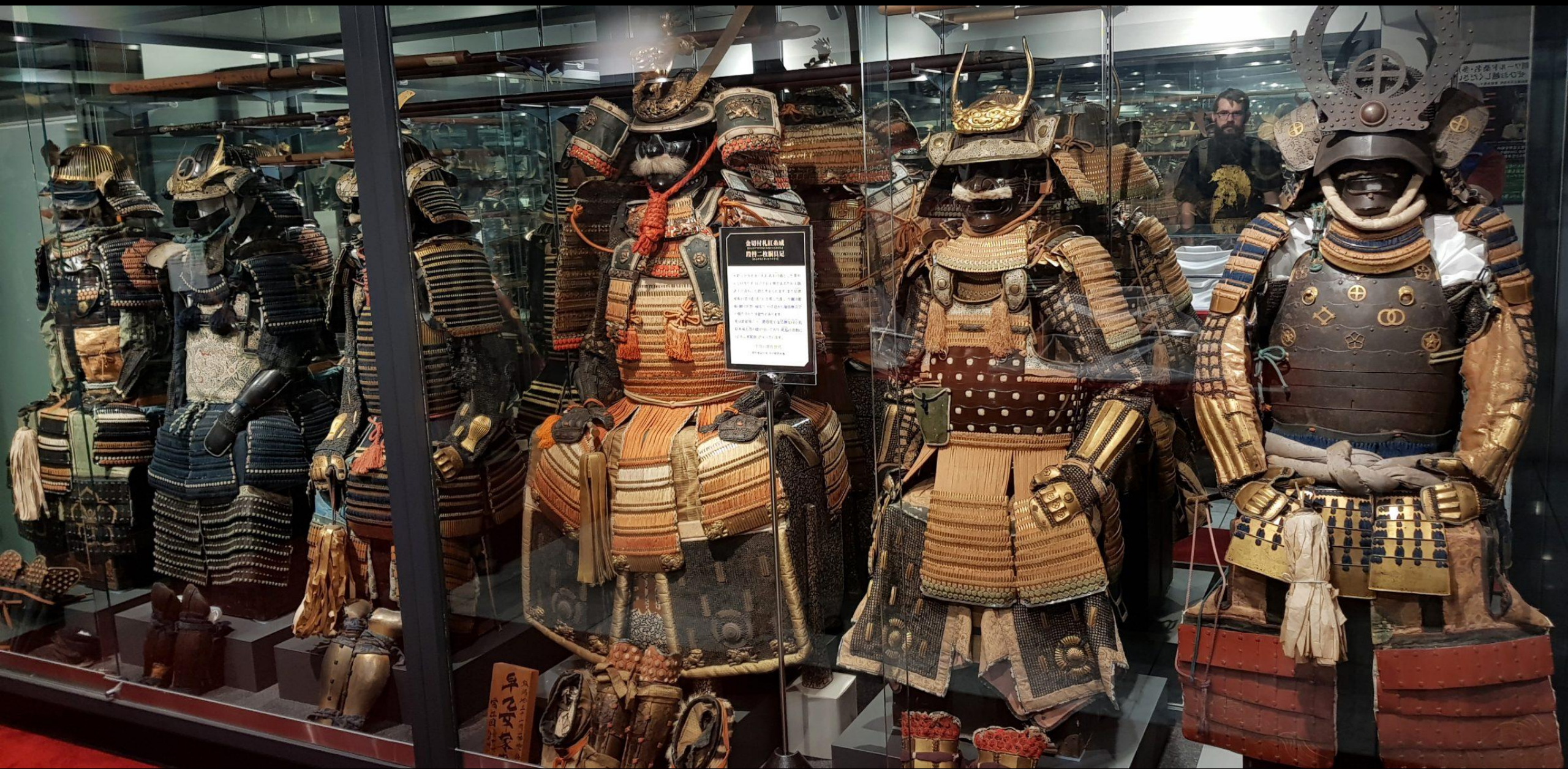
金切村札紅魚威 四将二枚胴具足